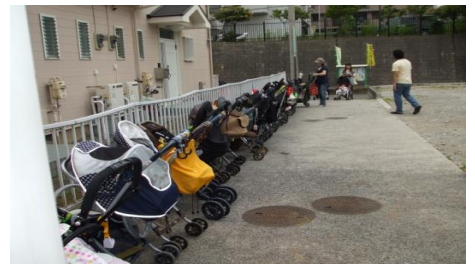
赤ちゃん 専用駐車場？