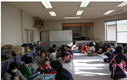
毎回多数の参加者で大賑わい

毎月第3水曜日開催の赤ちゃん会を支援。社協役員が赤ちゃんの受け取り、母親との交流・男子役員は場所の設定や後片付け等後方支援、この1年で350組のお世話を致しました。