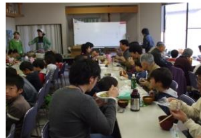
おばあちゃんと昔あそび