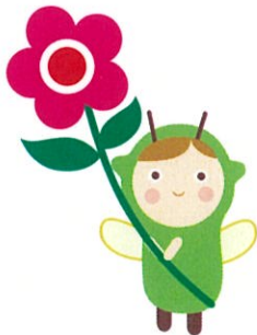
都筑区社協キャラクター ゆいピー

市営地下鉄「センター南」駅より 徒歩7分 公共交通機関でのご来場を お願いいたします！